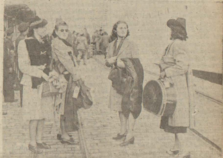
Dün Romanyadan şehrimize gelen İngiliz kadınları

Bir vapur muvasalatından 5 saat evvel İstanbul'a nasıl getirilir, içinde mevcut olmyan yolcularla nasıl konuşulabilir?